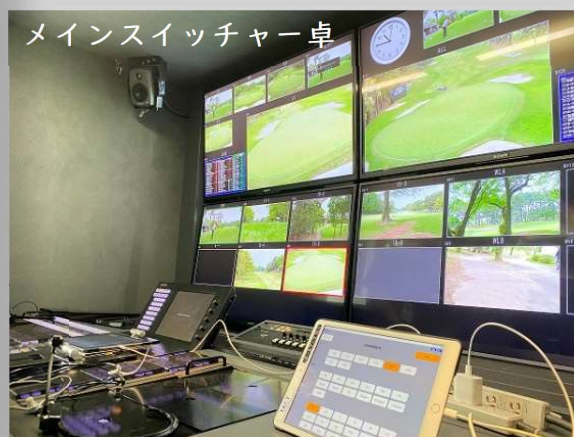
メインスイッチャー卓