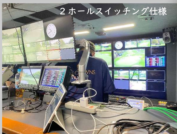
2 ホールスイッチング仕様